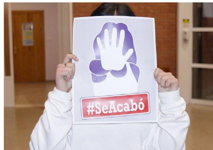
Una alumna con el lema del corto que han grabado sobre el 25N