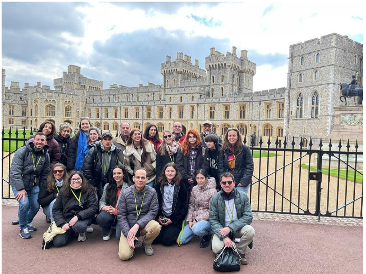
El grupo de alumnos de la Escuela Oficial de Idiomas de Teruel en su visita al Castillo de Windsor

Pero esto no fue todo ya que por la tarde alumnos y profesores viajaron en barco por las aguas del Támesis hasta llegar a Greenwich, navegando junto a lugares tan emblemáticos como The Tower Bridge o The City (la zona financiera de Londres). Al día siguiente el grupo se trasladó hasta Camden Town para pasear entre