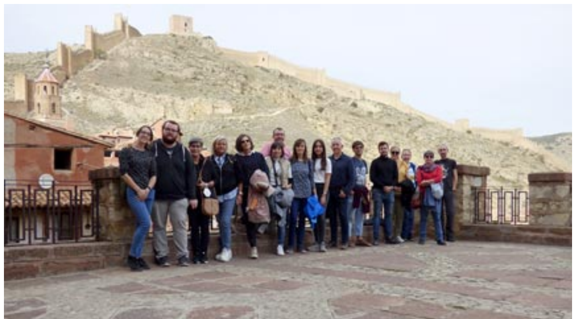
Los estudiantes de la Escuela de Idiomas se fotografiaron junto a la muralla de Albarracín