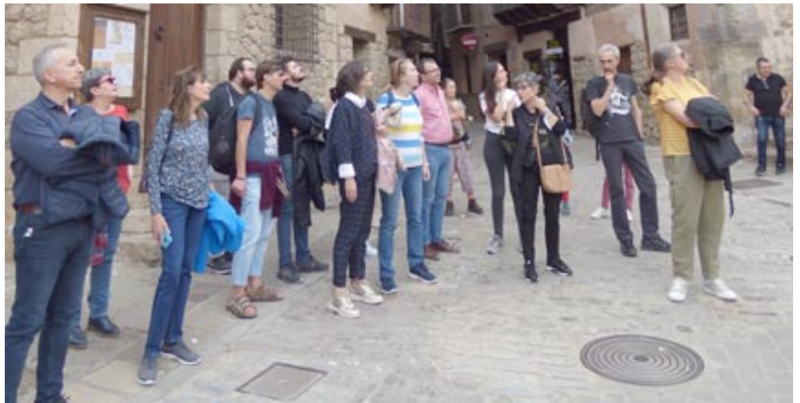
Alumnos de la EOI durante la explicación en la plaza Mayor de Albarracín

La tarde del jueves 27 de octubre fue propicia para la visita, el paisaje otoñal, la temperatura ambiente y la escasez de turistas, dio pie a que una vez finalizada la visita se pudiera seguir charlando en el idioma correspondiente con el resto de compañeros, favoreciendo la convivencia entre los diferentes niveles de estudios puesto que muchos de ellos no se conocían por tener las clases a distintas horas y días.