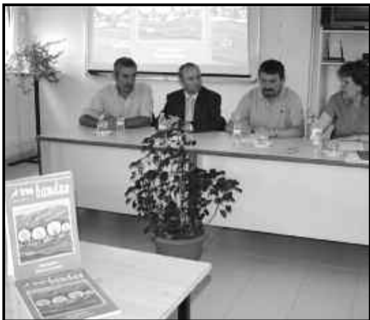
Presentación de la revista en el CPR de Teruel

Como siempre se incluye un monográfico que desarrolla distintos aspectos de una misma cuestión de interés para los maestros. En este caso se trata de las bibliotecas. "El departamento de Educación está haciendo verdaderos esfuerzos por po-