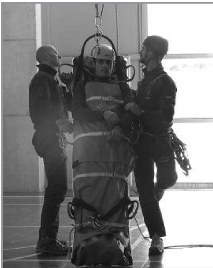
Los agentes durante la demostración de un rescate en Mora

Tras toda la demostración, los agentes fueron realizando preguntas a los escolares para ver si entendían lo que estaba sucediendo y si se